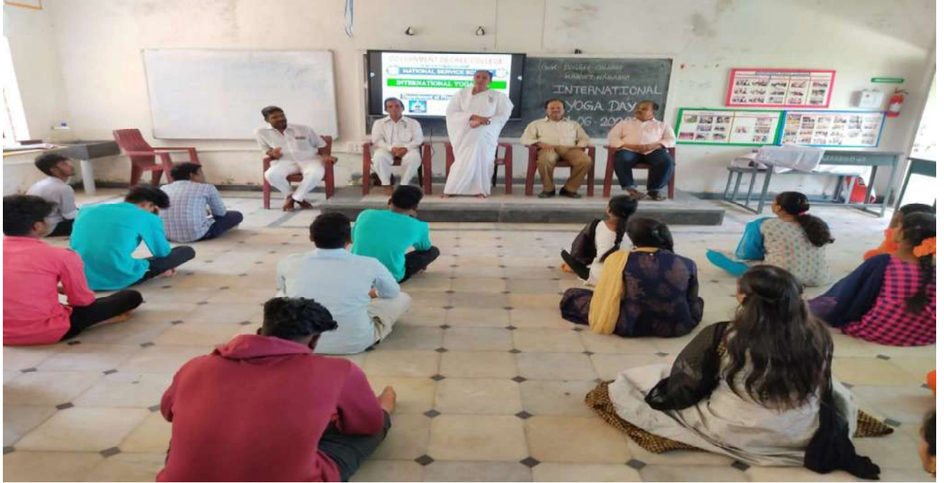
International Yoga Day celebrated on 21/06/2022 association with Bramha Kumaries