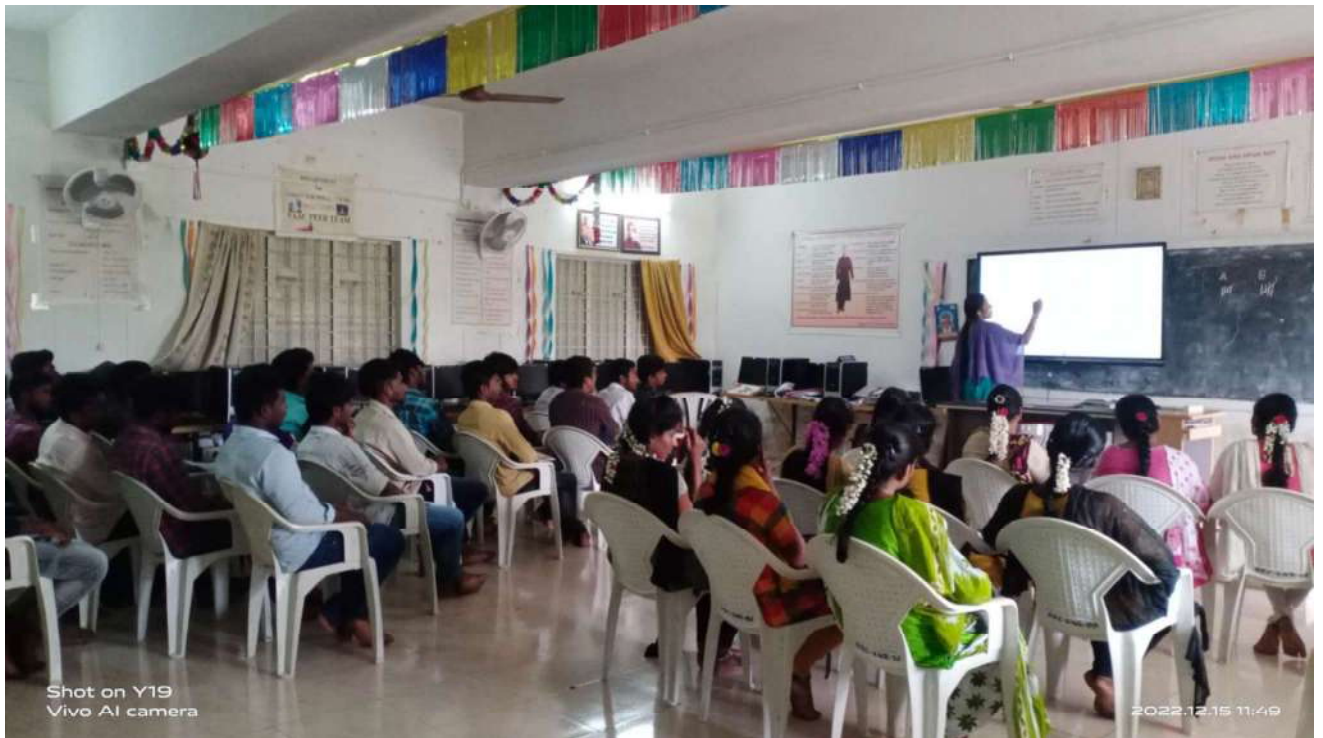
Shot on Y19 Vivo AI camera