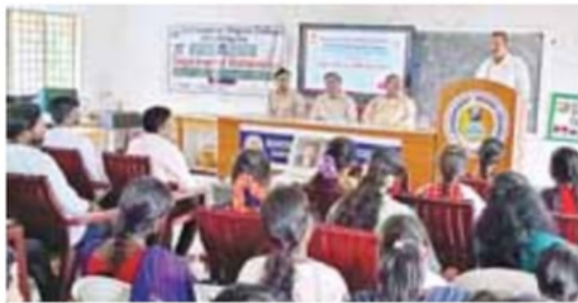
సమావేశంలో ప్రసంగిస్తున్న దృశ్యం